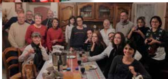
Une soirée pleine d'amitié entre voisins à Noël