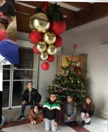
Décoration du sapin de la Mairie par le CME