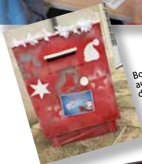
Boîte aux lettres du Père Noël