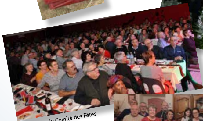
Les soirées du Comité des Fêtes