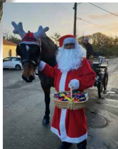
Arrivée du Père Noël à Frossay