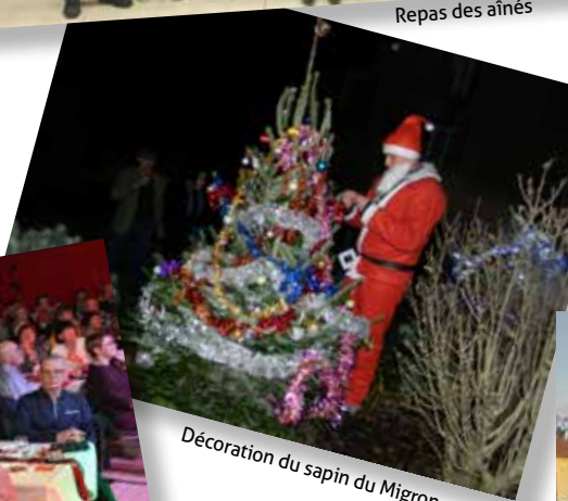
Décoration du sapin du Migron