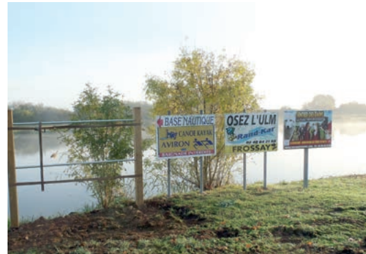
Panneau pour les associations au Migron