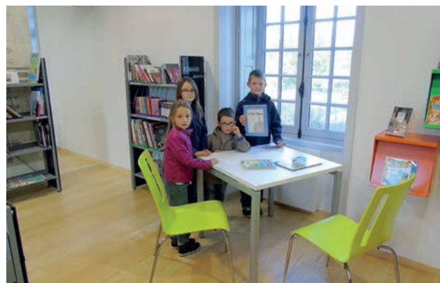
Le Jardin du Livre

Le 1 er conseil municipal des enfants a eu lieu le samedi 5 novembre.