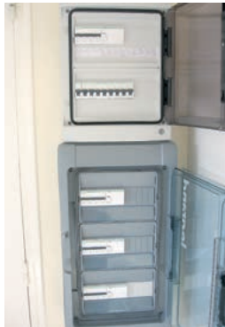
Réhabilitation de l'armoire électrique