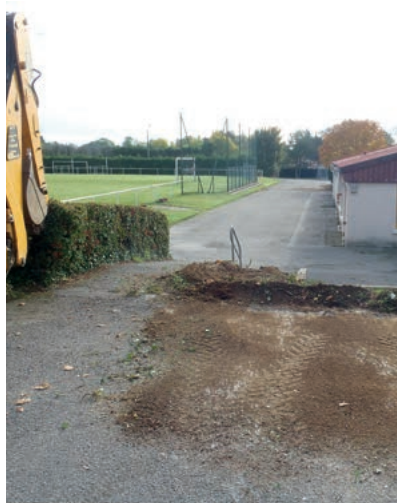
Travaux préparatoires de l'aménagement des abords de la salle polyvalente