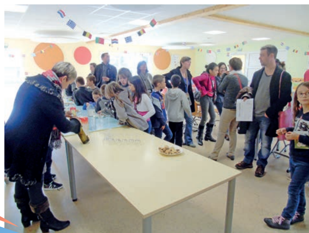
Clôture de la matinée avec le verre de l'amitié