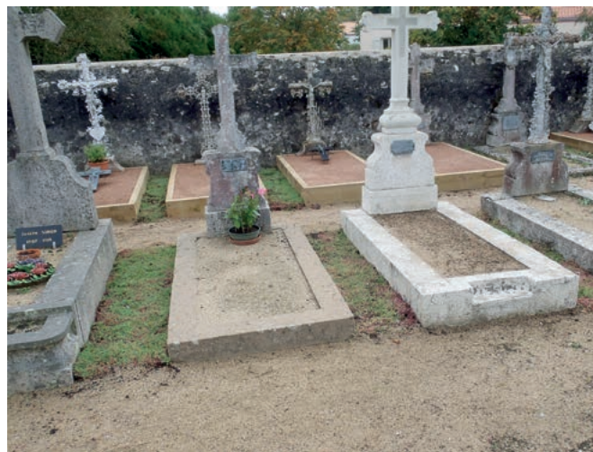
Aménagement des allées entre les tombes