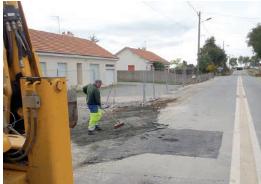
Remise en état d'une buse