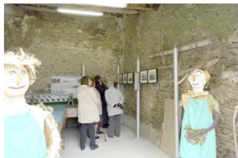
Maquette du pont tournant

Malgré une météo peu propice le public était au rendez-vous et comme à chaque fois les Frossetais se sont retrouvés dans cet espace de vie qu'ils apprécient tout particulièrement.