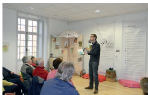
Les Brigades de lecture PaQ' la Lune

La compagnie « PaQ' la Lune » avec ses brigades de lecture faisait partager son univers de textes mis en scène et proposait aux enfants et adultes des ateliers de land art.