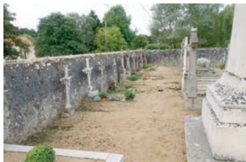
Aménagement du cimetière : Avant