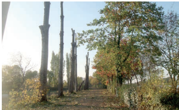
Abattage des peupliers