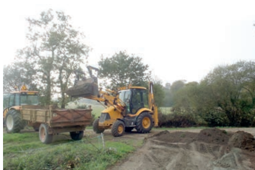
Reprofilage des chemins