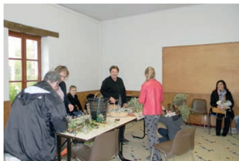
Atelier d'art floral

Sur place boissons, châtaignes grillées et restauration du midi étaient assurées par les membres du Comité des Fêtes.