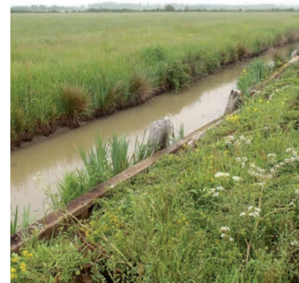
Prairie de Tenu