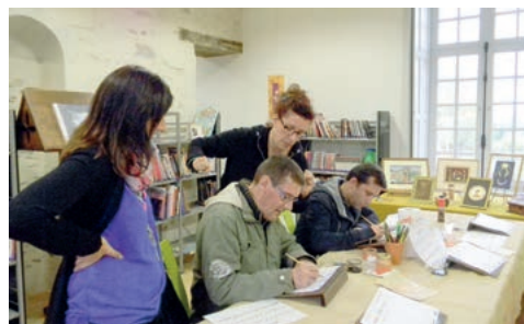
Atelier de calligraphie

Les visiteurs pouvaient profiter de l'occasion pour voir ou revoir la maquette du pont tournant remise dans un local proche de l'espace culturel et ouvert au public lors des événements de ce lieu.