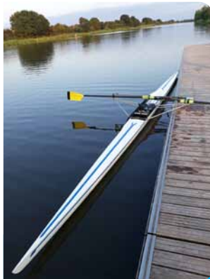
Notre nouvelle acquisition, en partie financée par une subvention municipale.

Si vous aussi vous souhaitez venir participer à une partie de l'histoire, alors n'hésitez plus et venez nous rejoindre pour de belles balades.