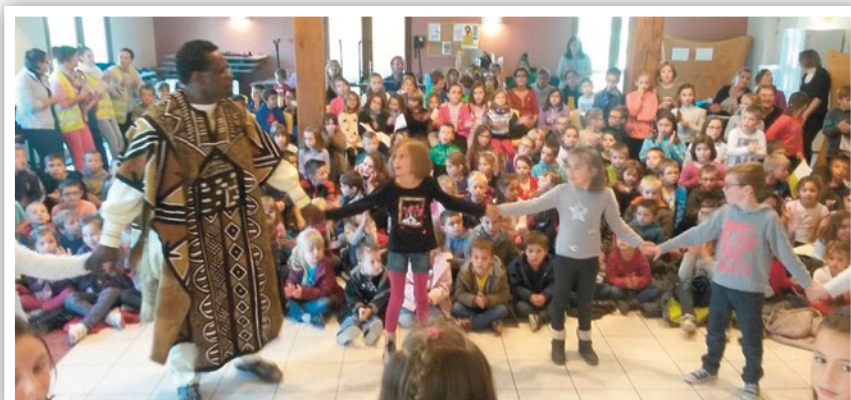
L'ensemble des élèves de l'école publique Alexis Maneyrol inscrit aux T.A.P. a assisté au spectacle de fin de période.