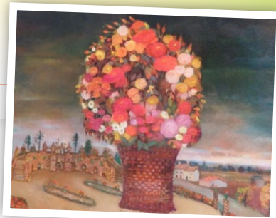
Le Bouquet au Calvaire - Peinture sur verre

La journée du Patrimoine a été l'occasion de la commémoration du centenaire de l'artiste peintre Anne Mandeville née à Frossay (1915-2011).