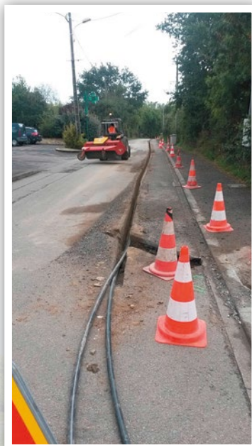
Travaux route de l'île