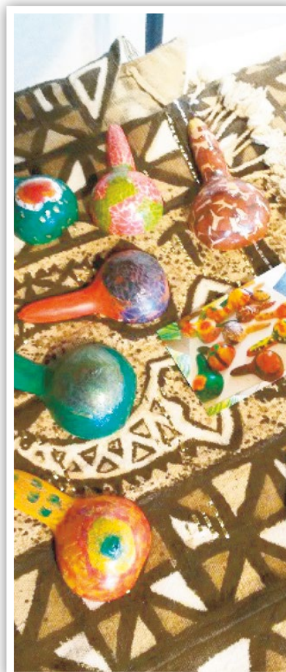
La période septembre octobre a permis aux enfants de fabriquer des calebasses.