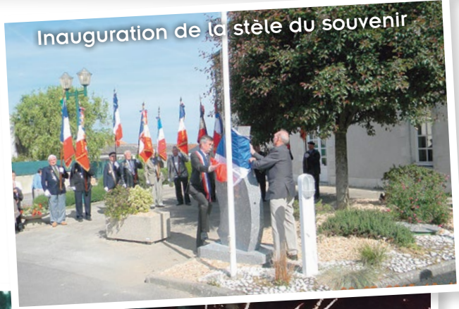
Inauguration de la stèle du souvenir