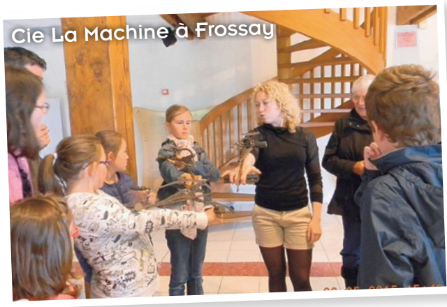
Cie La Machine à Frossay