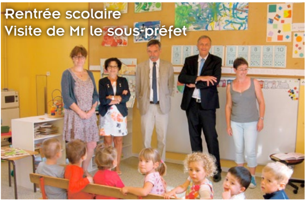
Rentrée scolaire Visite de Mr le sous-préfet