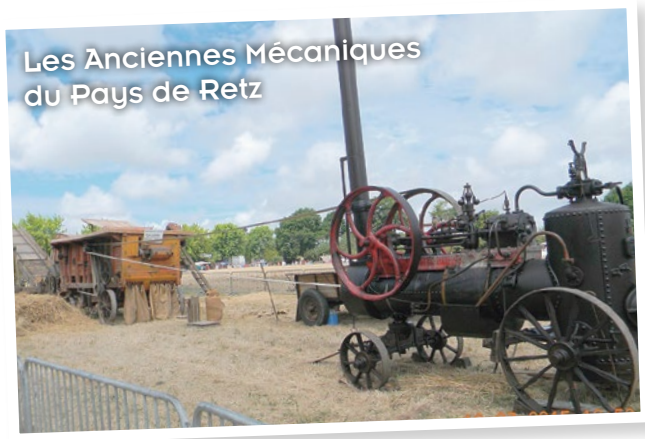
Les Anciennes Mécaniques du Pays de Retz