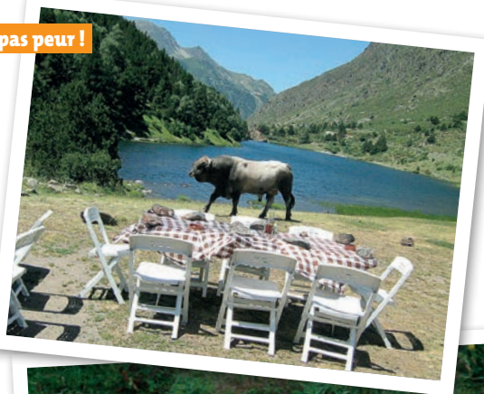
Même pas peur !