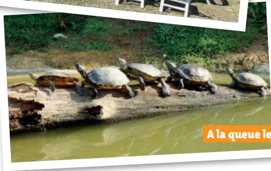
A la queue leu leu