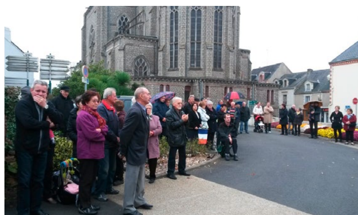
Cérémonie recueillement attentats du 13.11.2015