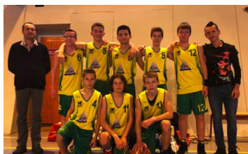
Equipe minimes garçons