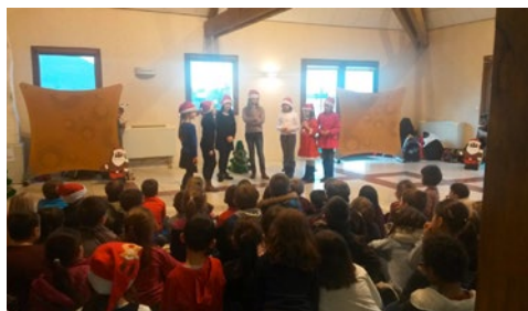
Spectacle de fin d'année des TAP le 18.12.2015